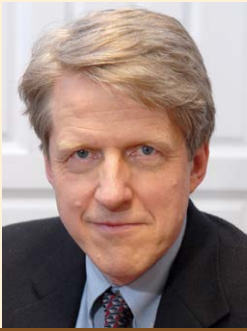
耶魯大學經濟學 羅伯·席勒 教授 Professor Robert J. Shiller