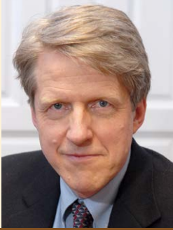
耶魯大學經濟學 羅伯·席勒 教授 Professor Robert J. Shiller