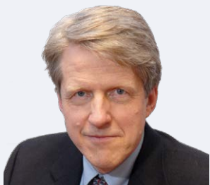
耶魯大學經濟學 羅伯·席勒 教授 Professor Robert J. Shiller