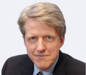
耶魯大學經濟學 羅伯·席勒 教授 Professor Robert J. Shiller