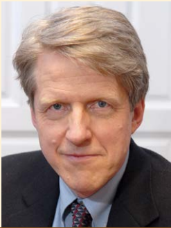
耶魯大學經濟學 羅伯·席勒 教授 Professor Robert J. Shiller