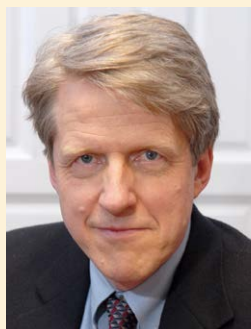
耶魯大學經濟學 羅伯·席勒 教授 Professor Robert J. Shiller